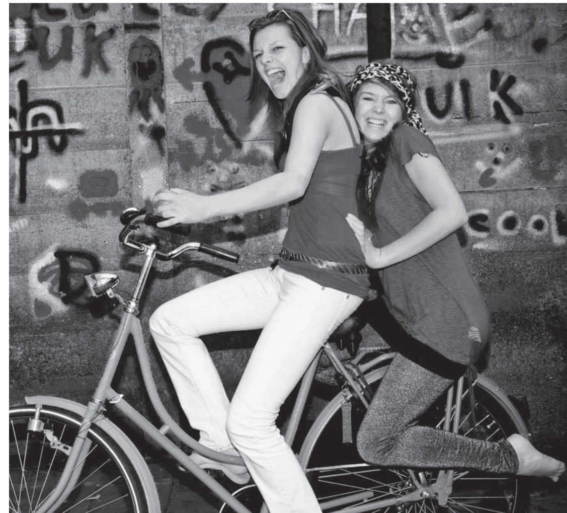
Het Nederlandse beleid zet in op levend en dynamisch erfgoed. Vanuit die visie verdient de fietscultuur zeker een plaats op de Nederlandse representatieve lijst.

Er is nog veel te doen, en dus gaan we, graag samen met het brede veld en andere overheden, hard aan het werk! ■