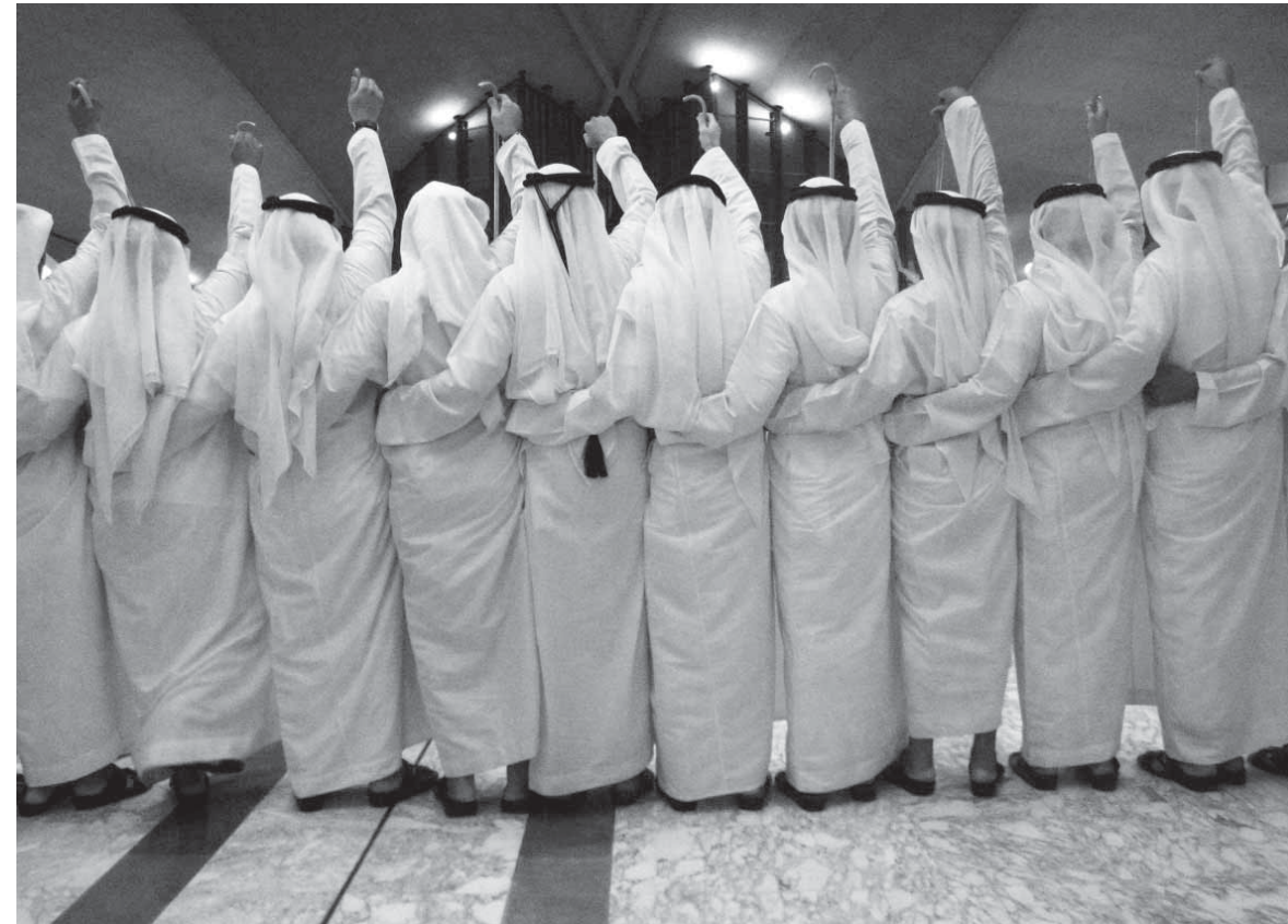
Omdat de vierde zitting van het intergouvernementele comité plaats vond in Abu Dhabi was er ruime aandacht voor de vaak onderbelichte Arabische cultuur.

worden ontvangen, bracht dit, in tegenstelling tot eerdere bijeenkomsten van het Committee, vele vertegenwoordigers van in totaal zo’n 40 NGO’s op de been, zoals onder veel meer de World Martial Arts Union, de Association de Nasreddin Hodja, de Goa Heritage Action Group, de Korea Cultural Heritage Foundation, de Craft Revival Trust, en ook vertegenwoordigers van internationale organisaties als ICOM, ICOMOS en de International Social Science Council.