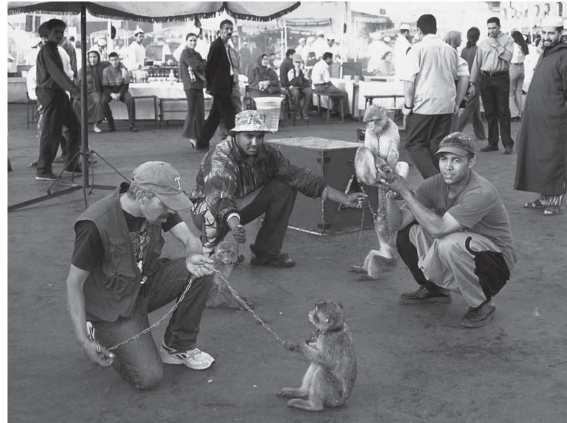
Jamaa'el-Fna, het marktplein in Marrakech waar het allemaal begon met de oproep van Juan Goytisolo om deze culturele ruimte te bewaren voor het nageslacht.