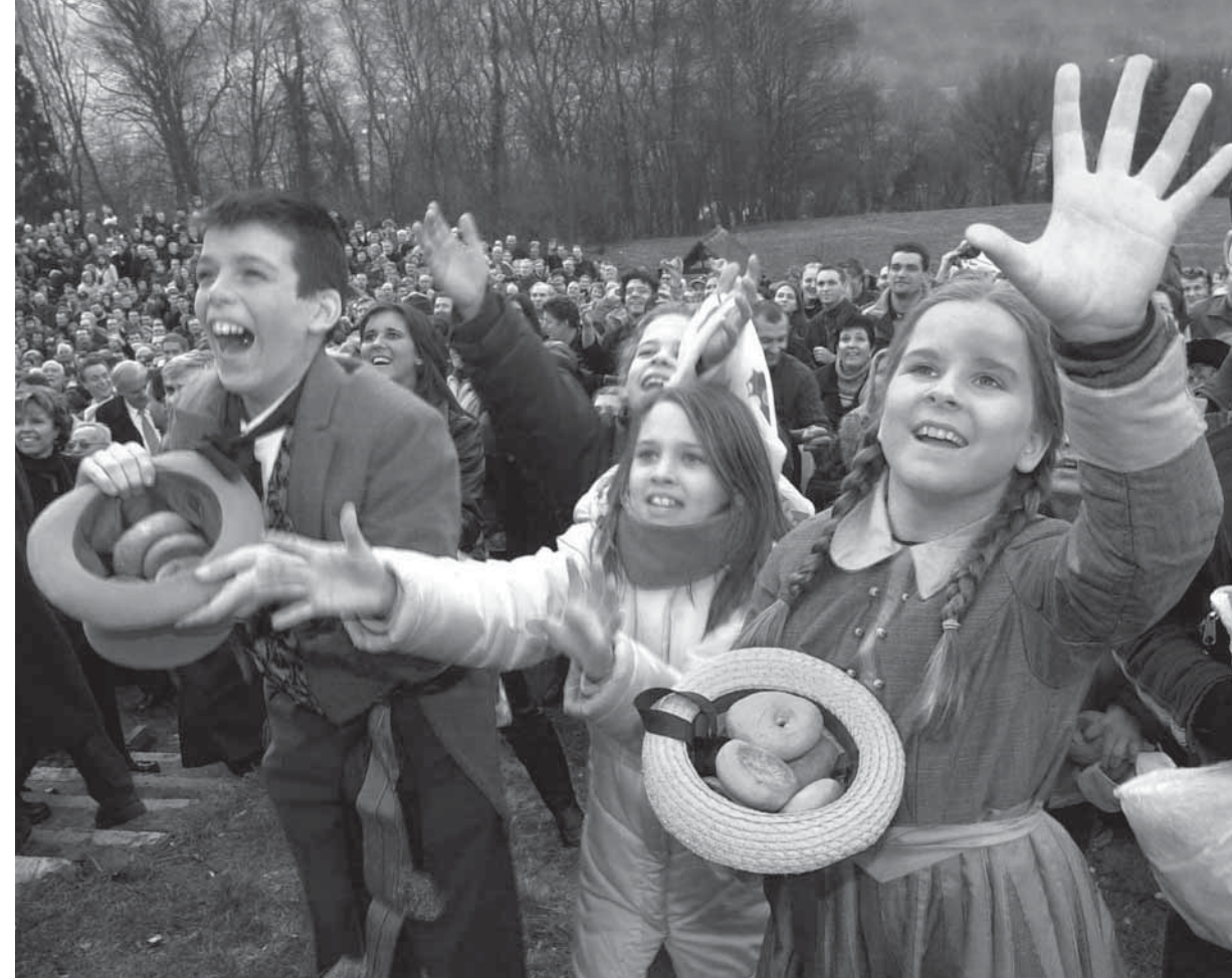
Tonnkensbrand is een Vlaams vuurfeest dat in Geraardsbergen in ere wordt gehouden. Het feest is bedoeld 'om de winter te verjagen'. De eregasten bij het festijn mogen 's middags krakelingen in de menigte werpen.