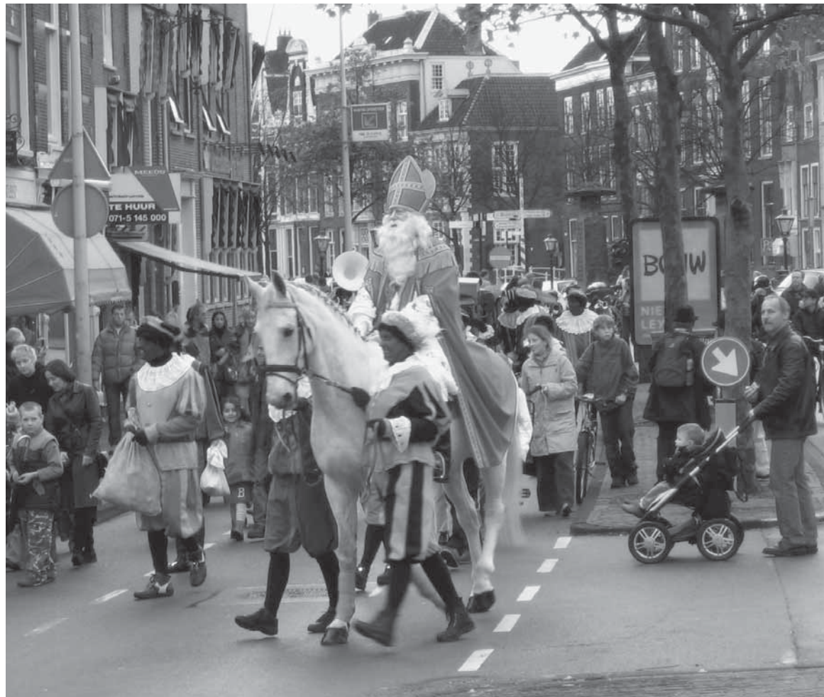
Inkomst Sinterklaas in Leiden

Uit de enquête komt evenwel naar voren dat gemeenten in Nederland over de betekenis van eenzelfde fenomeen, vanuit het oogpunt van eventuele subsidiëring, diametraal tegenovergesteld kunnen denken: 'met de intocht van de goedheilig man is geen gemeentelijk belang gediend' (FR). Een ambtenaar van een gemeente in Gelderland komt tot eenzelfde conclusie: 'Kijk je naar beleid dan zou de intocht van sinterklaas nog het meest gelinkt kunnen worden aan het cultuurbeleid (volks-