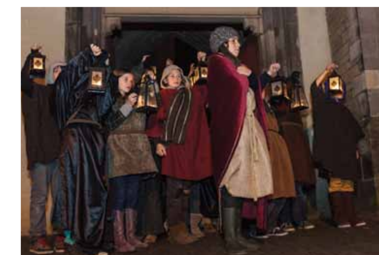
Om het leven van Sint Maarten te vertellen, wordt het verhaal nagespeeld.