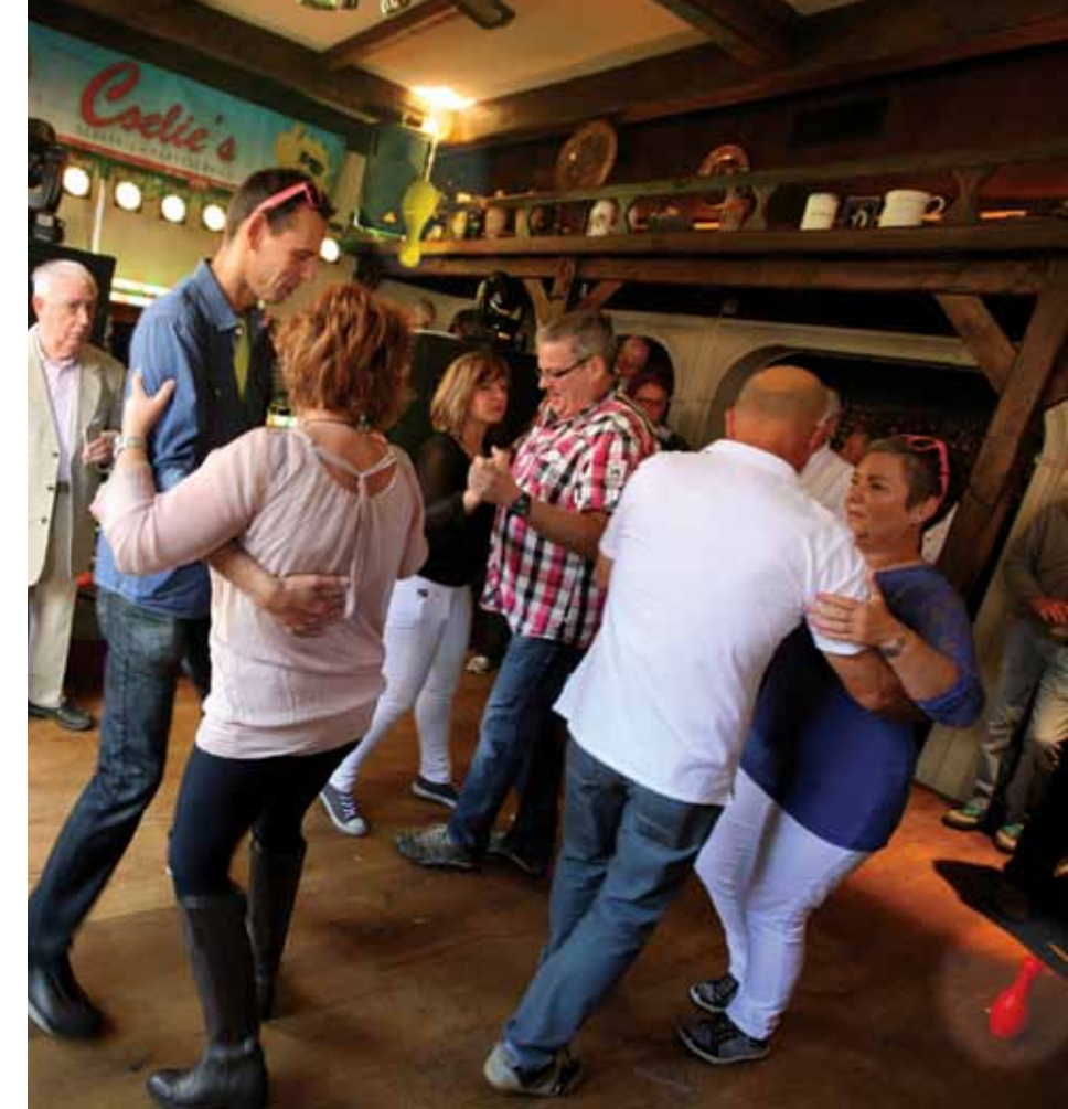
Bij het ene café staan de kegels op de grond en bij het andere café hangen ze aan het plafond. De dansende paren mogen de kegels niet raken.

De dorpsraad zet zich in voor de leefbaarheid van het dorp en maakt zich sterk voor het behoud van het prijsdansen. De raad wil veel doen voor de versterking van de sociale cohesie.