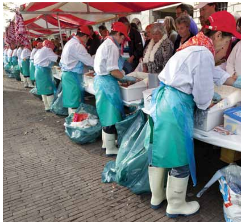
De watergeuzen trakteerden de hongerige Leidenaren op haring en wittebrood, een gebruik dat nog bestaat en door veel mensen zeer wordt gewaardeerd.

Per (on)geluk was ook het thema van de Grote Optocht in de middag. Met een knipoog wordt aangestipt dat 13 weliswaar een ongeluksgetal is, maar dat 2013 wel een geluksjaar is. Want de wereld is in 2012 niet vergaan, ondanks de voorspelling van de Mayakalender. Bovendien, in 13 zitten de getallen 3 en 10 en die staan voor 3 oktober, de geluksdag voor de Leidenaren!