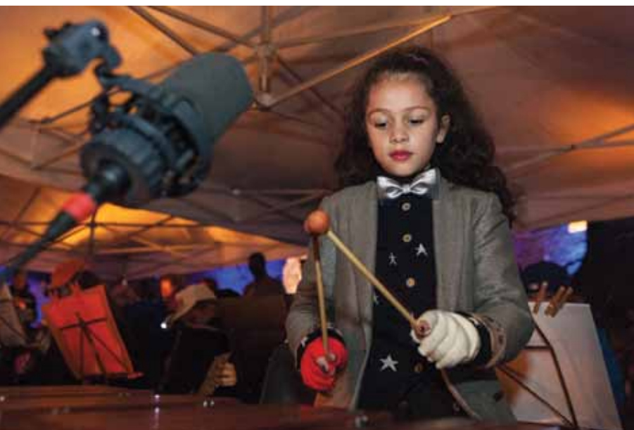
De Fanfare van het Vuur betreft via schoolmuziekprojecten kinderen bij het Sint Maartensfeest.

zich en werd achtereenvolgens duiveluitdrijver, kluizenaar, stichter van een religieuze orde en bisschop in Tours. Naar verluidt heeft hij vele wonderen verricht en het feit dat hij zijn halve mantel aan een naakte bedelaar schonk, maakte hem nog geliefder. Hij werd al snel een populaire heilige in de Middeleeuwen. In Utrecht werd al vroeg een kerk aan hem gewijd die later zou uitgroeien tot de Domkerk, en later werd hij de beschermheilige van de stad.