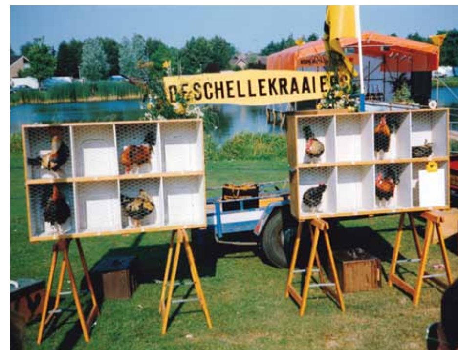
Bij de wedstrijd Hanenkraaien gaat het erom dat de haan zoveel mogelijk kraait.

Schaafsma vertelt vol enthousiasme dat hij eind november 2010 het verzoek kreeg om voor het blad Kontakt het boek Dit zijn wij. De 100 belangrijkste tradities van Nederland te recenseren. Hij realiseerde zich toen dat hij al veel immaterieel erfgoed van Eelde in kaart had gebracht. Hij vatte het plan op om vier rapporten uit te brengen in de kleuren oranje, rood, wit en blauw. Op basis van wat hij al geschreven had voor het blad Kontakt wilde hij eerst in de oranje bundel toelichtingen, reacties en aanvullingen leveren – met een Eelder bril op – op de honderd tradities die in Dit zijn wij worden genoemd. De oranje bundel verscheen al in januari 2011 onder de titel Een Eelder kijkt op oude en nieuwe gebruiken in het kader van 2011 en 2012 Jaren van het Immaterieel Erfgoed .