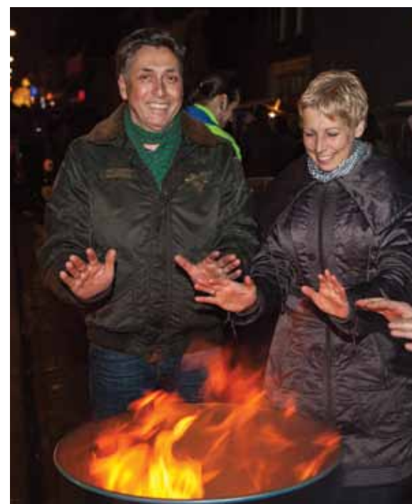
Het is heel spannend om 's avonds in het donker met een lampion door de oude straten van Utrecht te lopen.

We willen graag contacten met de steden langs de Via Trajectensis, in eigen land en in het