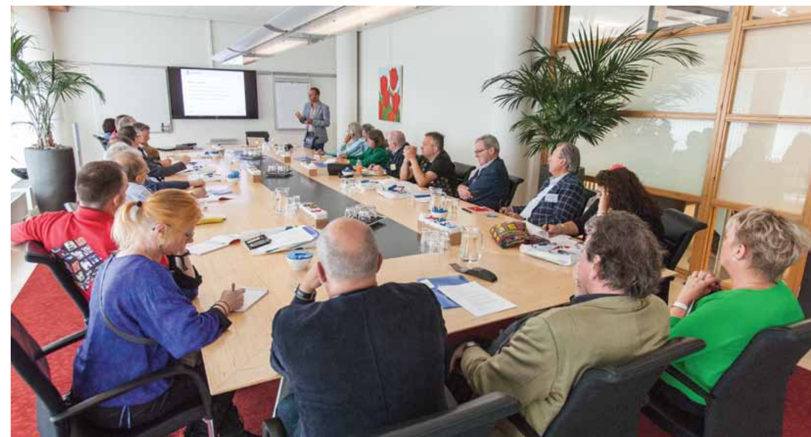
De gemeenschappen hebben voor een deel dezelfde vragen, zoals hoe breng ik mijn traditie in de klas en hoe interesseer ik de pers.

In verschillende workshop sessies werden de verschillende thema's uitgewerkt door enkele experts. In de werkgroep over publiciteit ging het over het benaderen van de pers, die altijd in is voor een interessant verhaal, maar dan moet