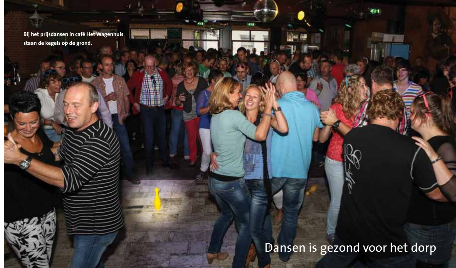
Bij het prijsdansen in café Het Wagenhuis staan de kegels op de grond.