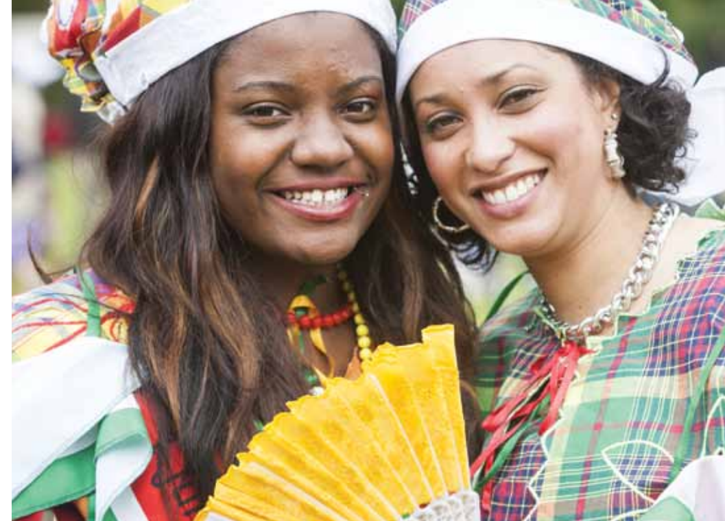
Acht van Chaam

T wee jaar na de ratificatie begint het immaterieel erfgoedbeleid langzaam vorm te krijgen in Nederland. In snel tempo heeft het Nederlands Centrum voor Volkscultuur en Immaterieel Erfgoed (VIE) een structuur opgezet waarin gemeenschappen een kader wordt opgeboten om ze te ondersteunen bij het levensvatbaar houden van tradities die ze zelf belangrijk vinden. De Nationale Inventaris Immaterieel Cultureel Erfgoed fungeert daarbij voor een breed publiek als een zichtbaar en aansprekend herkenningspunt. De snelle toevloed aan voordrachten voor de Nationale Inventaris leert dat de gemeenschappen zich blijkbaar aangesproken voelen door de UNESCO Conventie en ook, ondersteund door VIE, hun weg hebben weten te vinden op dit nieuwe beleidsterrein. Zoals de Raad voor Cultuur het formuleert in een recent advies aan de Nederlandse regering: 'het ratificeren van het verdrag [is] een goede keus geweest', Nederland 'neemt door de ratificatie 'zijn verantwoordelijkheid voor de zorgvuldige omgang met immaterieel erfgoed'. Wat echter wel eens wordt vergeten is dat in de UNESCO Conventie dergelijke lijsten en inventarissen niet het doel zijn maar slechts een middel om gemeenschappen te helpen en ondersteunen in hun erfgoedzorg. Het is met name dit punt dat nadere aandacht vereist.