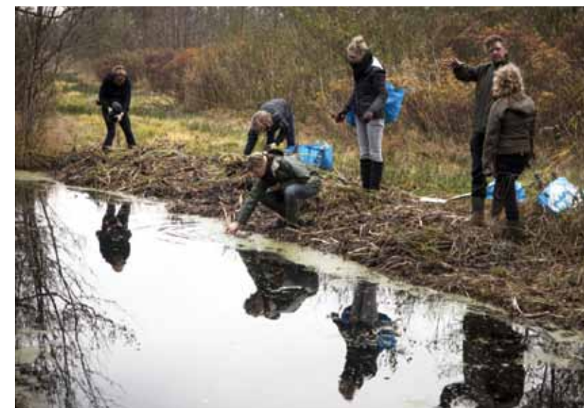
Deelnemers aan de workshop trekken de natuur in om materiaal te verzamelen.

‘De plaatsing van het ambacht papierscheppen op de Nationale Inventaris Immaterieel Cultureel Erfgoed heeft me zoveel leuke contacten en projecten opgeleverd! Zo heb ik de meesterproef afgenomen bij de papierscheppers van het Nederlands Openluchtmuseum. En door het geven van masterclasses in de stand van VIE tijdens de Dutch Design Week in 2013 ben ik in contact gekomen met studenten uit het kunst-