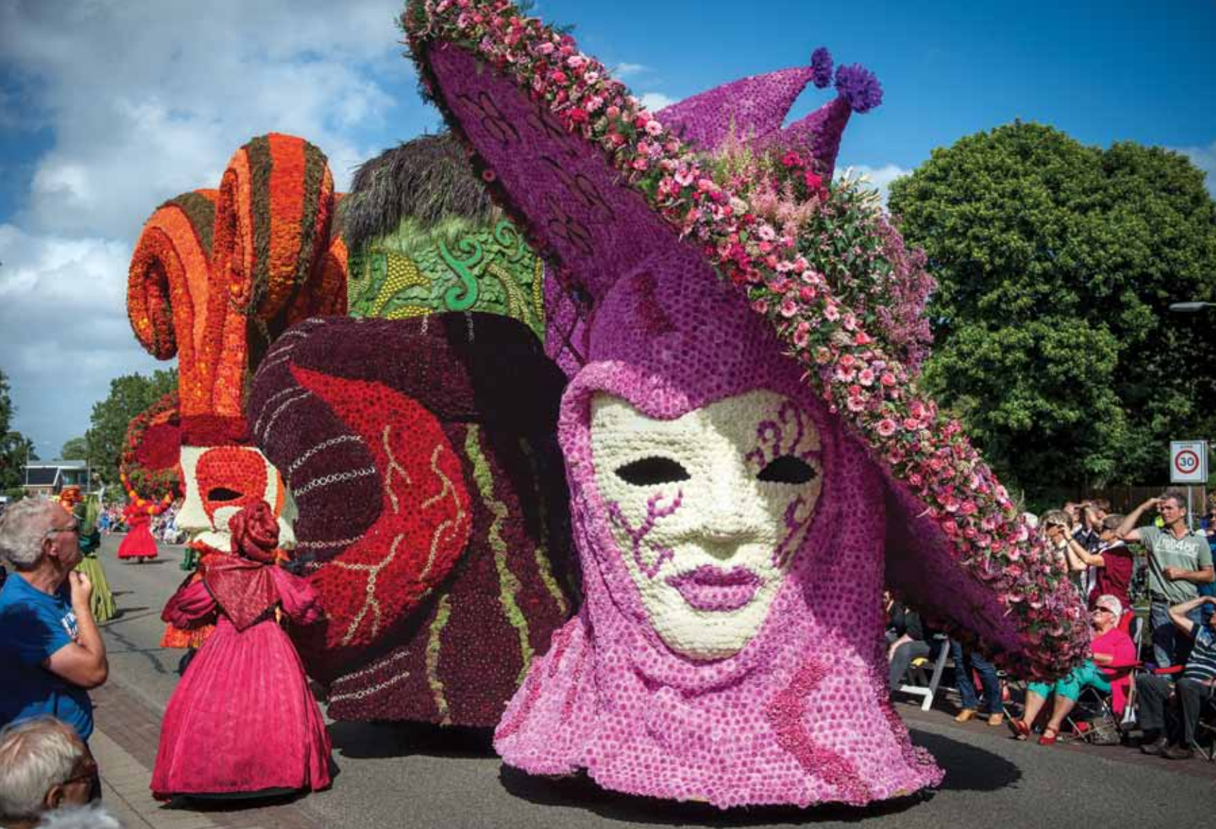
Het Bloemencorso Eelde staat op de Nationale Inventaris Immaterieel Erfgoed in Nederland.

Inventarisatie van immaterieel erfgoed in Eelde