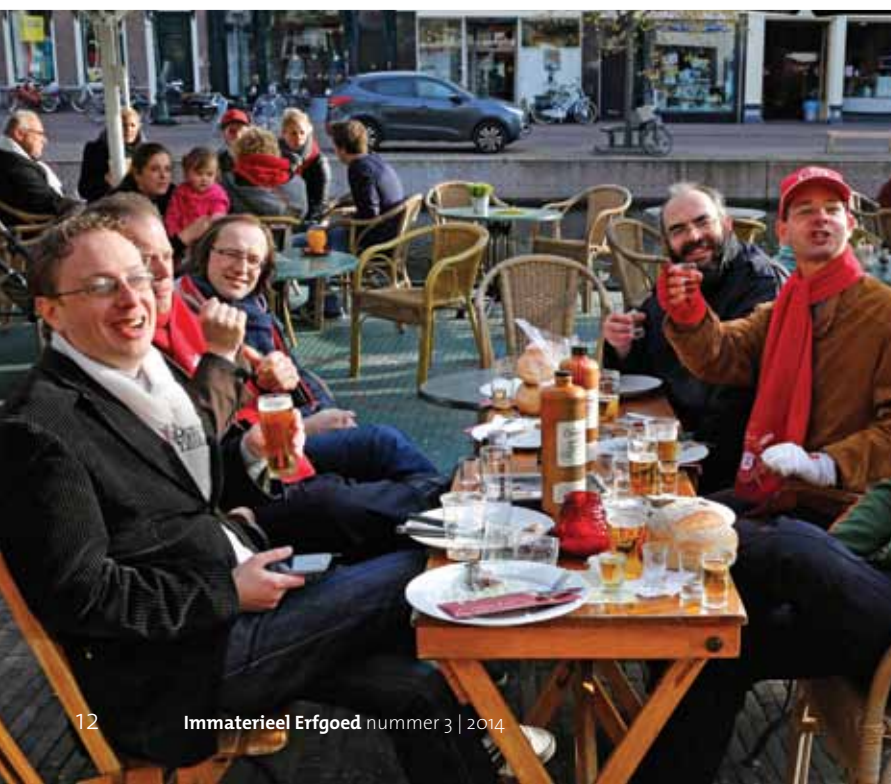
De bevolking geniet van de sfeer in de stad en van brood met haring en een glaasje jenever.