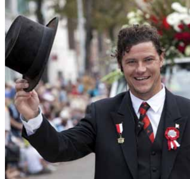
De elf bestuursleden van de 3 October Vereeniging zijn tijdens de feesten herkenbaar aan het jacquet, de hoge hoed en de paraplu.

bereikte stormkracht en het wassende water joeg de belegeraars op de vlucht. Cornelis holde met dit bericht en de hutsput naar de stad en is daarmee onsterfelijk geworden. Feest brachten ook de Geuzen die dezelfde ochtend de stad binnenvoeren en de uitgehongerde bevolking trakteerden op haring en wittebrood.