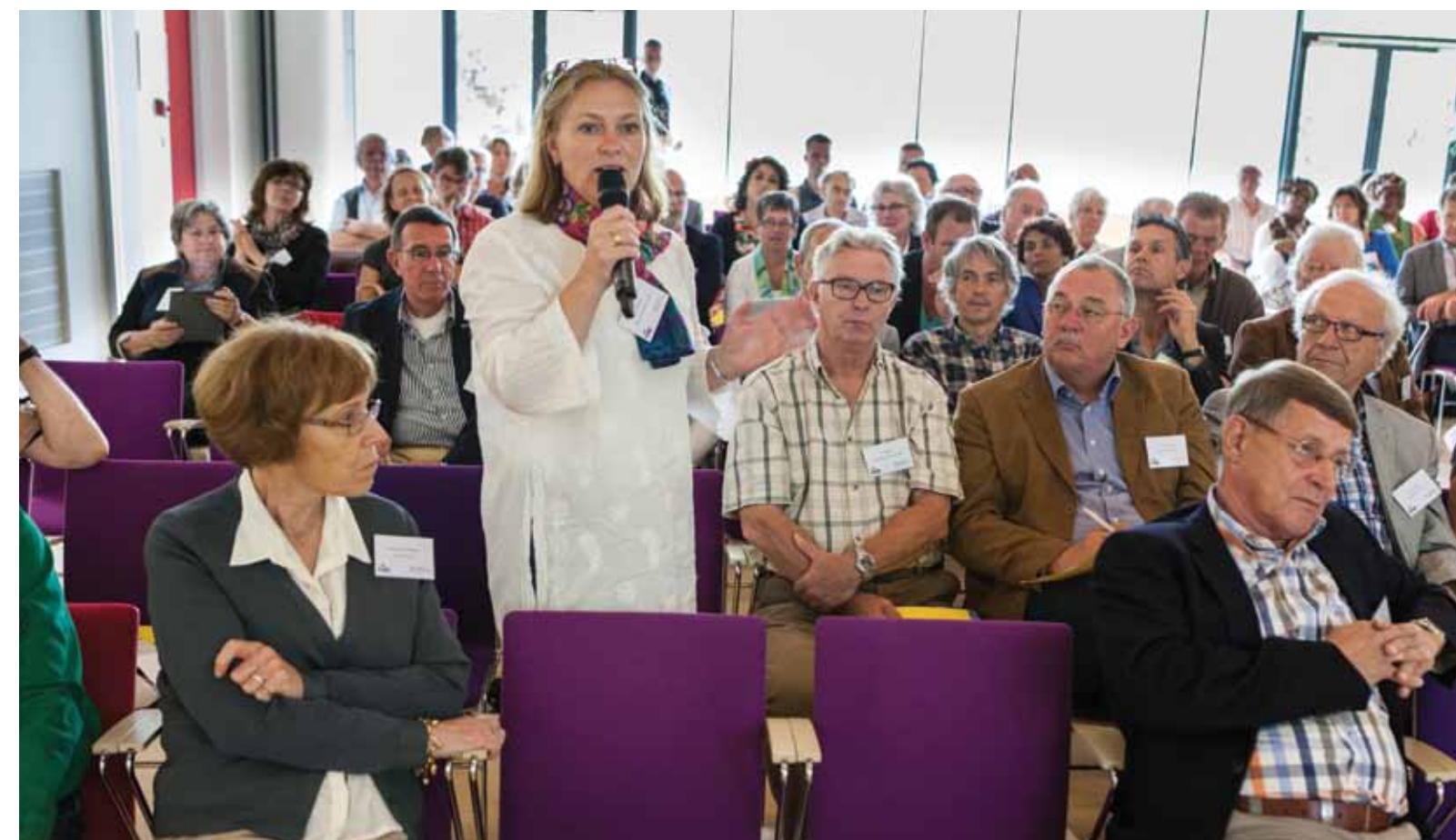
De contactdagen zijn bedoeld om vragen en problemen met elkaar door te spreken en ervaringen uit te wisselen.