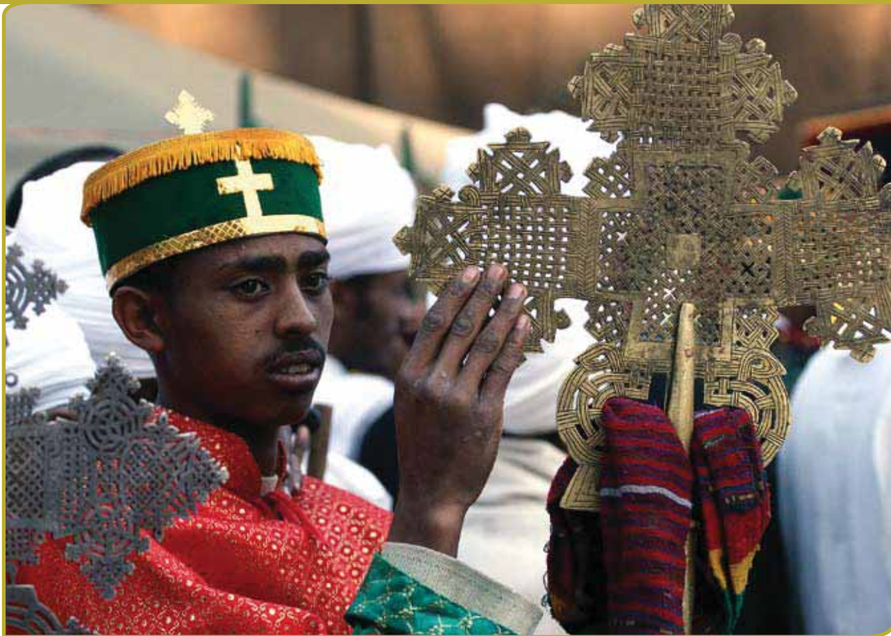
De dragers van culturele tradities moeten behandeld worden als bevoorrecht, omdat zij de betreffende tradities hebben gecreëerd, gekoesterd en hooggehouden. Foto: Timkatfestival in Ethiopië

De definitie veronderstelt het bestaan van een groep mensen die een bepaalde vorm van culturele expressie erkennen als symbool van hun gemeenschappelijke identiteit, die het conceptueel plaatsen in een zelfweerspiegelende categorie 'erfgoed' gelegitimeerd door historisch gebruik en specifiek aangeduid als waardevol (Early en Seitel 2002). Dit betekent dat immaterieel cultureel erfgoed deze aanduiding niet kan behouden als het wordt toegeëigend door anderen die geen deel uitmaken van die gemeenschap – of dat nu overheidsfunctionarissen, wetenschappers, kunstenaars, zakenlieden of anderen zijn. De definitie veronderstelt ook dat immaterieel cultureel erfgoed is gekoppeld aan sociale processen en andere aspecten van het leven. Het is niet iets dat gemakkelijk los kan worden gezien van