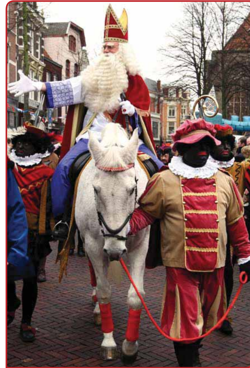
Niet in iedere gemeente is het gemakkelijk om aan een schimmel voor Sinterklaas te komen.

de daarbij toegewezen verantwoordelijkheden tot in het absurde', schreef een comité in de provincie Utrecht. De organiserende winkeliersvereniging in Oudorp bij Alkmaar stelde zelfs: 'De gemeente is er blijkbaar veel aan gelegen om onze initiatieven te dwarsbomen.' 3 Het blijkt 'slopend om de juiste vergunningen aan te vragen (muziekvergunning, collectievergunning, enz). Dit kost veel energie, maar ook veel geld' (Partij Wittem). Verschillende gemeenten stellen hoge eisen aan de veiligheid voor de toeschouwers. Tegelijkertijd moet begeleiding van de optocht door de politie in sommige plaatsen achterwege blijven in verband met bezuinigingen, een nieuwe taakopvatting of gebrek aan mankracht. Comités moeten dan voor eigen