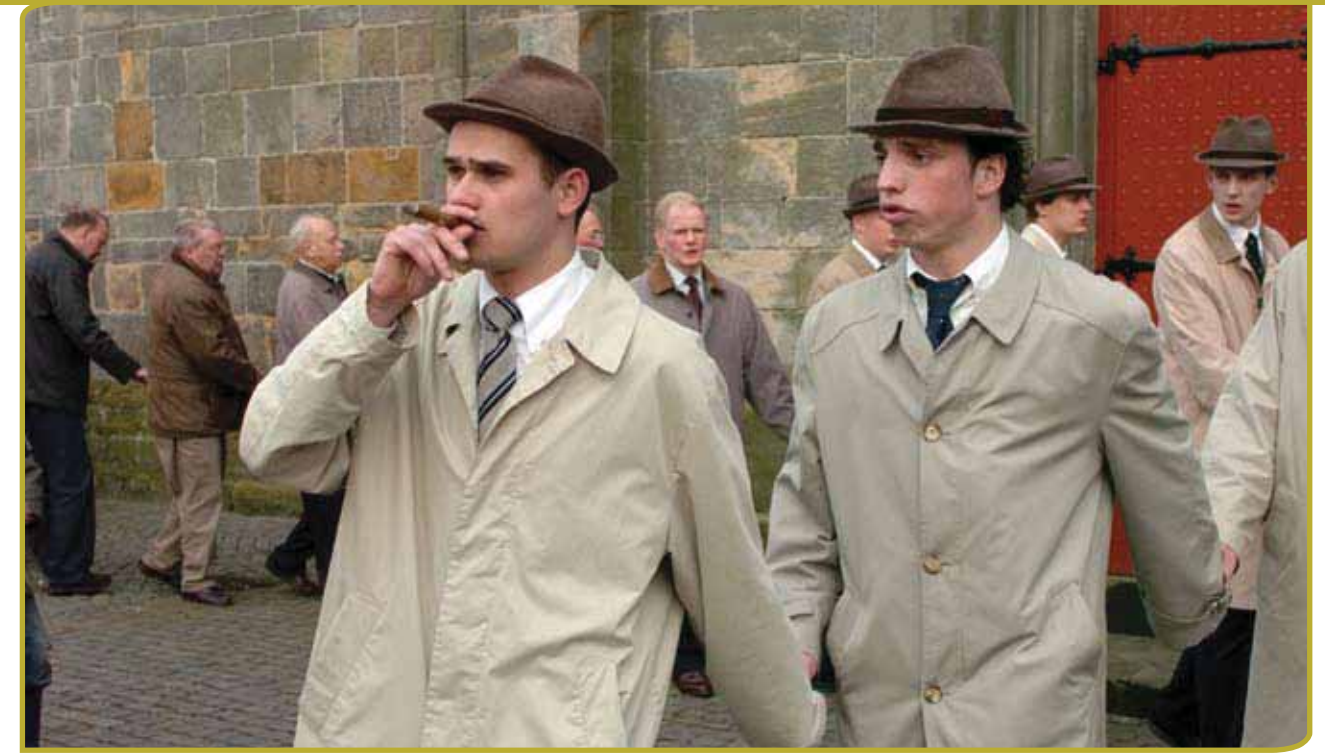
Het vlögelen is een traditie in Ootmarsum, die elk jaar weer veel toeristen trekt.

Het maken van inventarissen was een onderwerp dat een groot deel van de discussies in beslag nam tijdens het opstellen van de Conventie. Velen zagen het als een management tool – hoe kon een land weten wat het beschermde en wat voor vooruit-