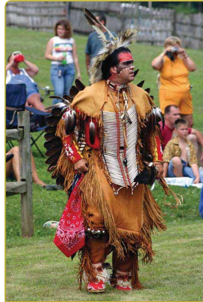
In de Verenigde Staten willen veel etnische groepen hun erfgoed behouden.

Er staat in de Conventie ook niet veel over de manier waarop culturele presentaties, promotionele activiteiten en onderwijs de beschermingsactiviteiten zouden kunnen versterken of kunnen vertrouwen. Hoewel dit waarschijnlijk het beste kan worden overgelaten aan het domein van praktijkvoorbeelden ( best practices ) die zullen worden beoordeeld na afloop van de