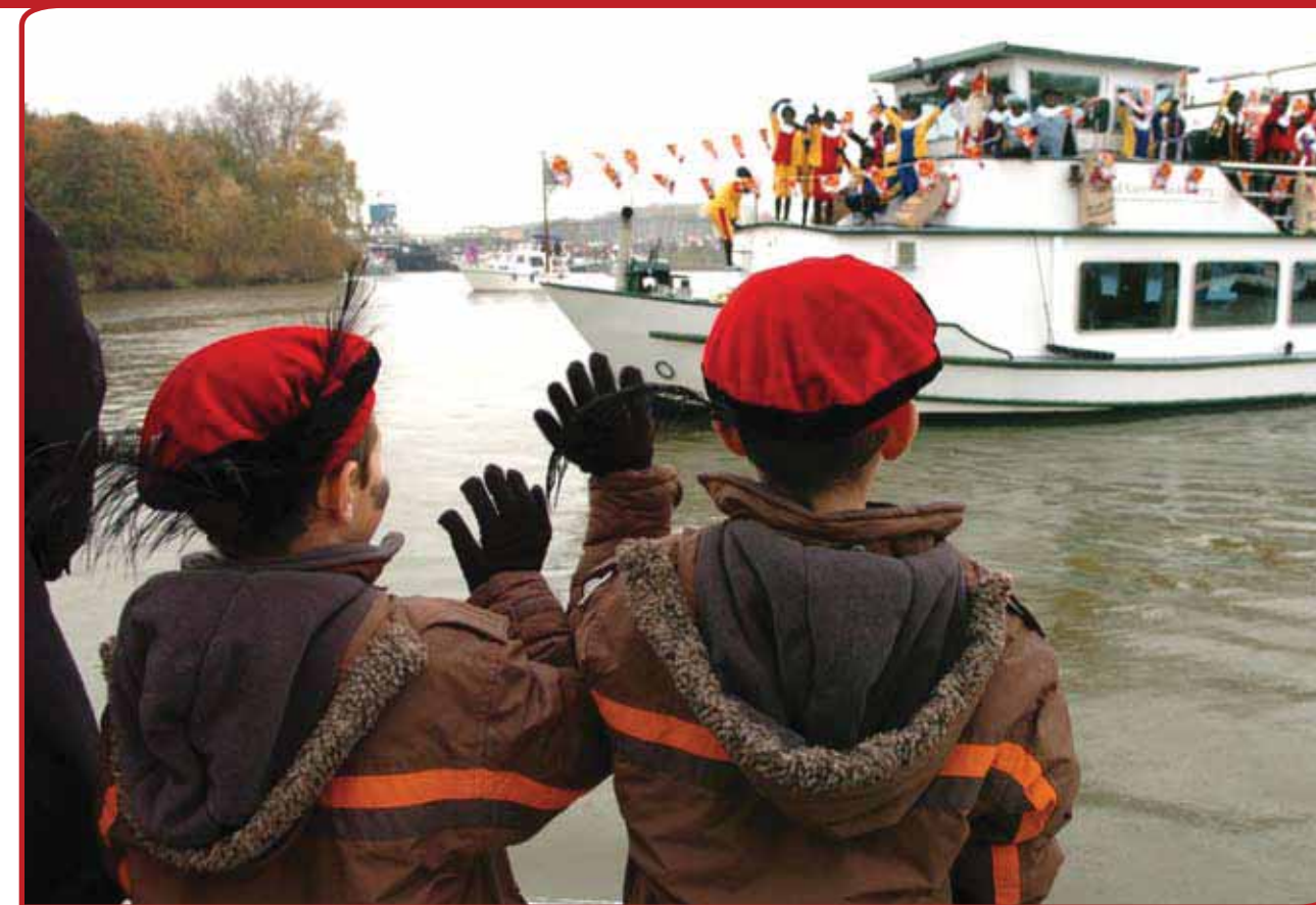
De Sinterklaasoptochten worden meestal georganiseerd door een Sint-Nicolaas Comité, een plaatselijke sport- of jeugdvereniging of een winkeliersorganisatie.

Daaruit bleek dat de sinterklaasintocht uitgaat van ruwweg drie soorten organisaties. In de eerste plaats is dat een speciaal 'Sint-Nicolaas Comité'. Daarnaast zijn er verenigingen, met name sport-, toneel-, oranje-, jeugd- of speeltuinverenigingen, die zich er naast hun hoofddoelstelling ook verantwoordelijk voor voelen dat Sinterklaas zijn intocht houdt in hun plaats. En tenslotte natuurlijk de lokale winkeliers- of ondernemersverenigingen, waarvoor hetzelfde geldt. Anders dan vaak gedacht zijn zij zeker niet het enige type organisator. Enkele gemeenten laten de intocht organiseren door een eigen stichting. De eerstverantwoordelijke voor de optocht staat er doorgaans niet alleen voor. Er bestaan dwarsverbanden met andere verenigingen, scholen of ondernemers die het comité steunen met financiële bijdragen of met vrijwillige mankracht. Menige site van een Sint-Nico-