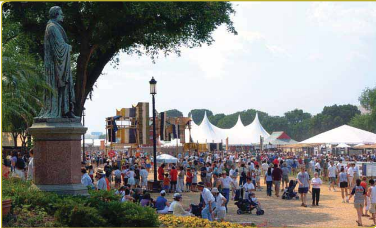
Door het Smithsonian Folk Festival wordt aan de beoefenaars van het immaterieel erfgoed in de VS getoond dat hun cultureel erfgoed en hun pogingen om hun tradities te behouden worden gewaardeerd.

Veel muzikanten zouden zelfs doorgaan met het bespelen van hun instrumenten en het zingen van hun liedjes als zij niet zouden worden betaald. Maar voor velen maakt de geldelijke beloning het mogelijk hun werk voort te zetten – vooral omdat er in de huidige maatschappij een wijziging heeft plaatsgevonden in de vormen van bescherming en ondersteuning. Er zijn geen hoven en koningen, plaatselijke heersers en ontmoetingsplaatsen meer, en – gegeven de migratie en diaspora – kan toegang tot en profijt van de markt een middel verschaffen voor het voortzetten van een op traditie gebaseerd, hoewel getransformeerd, cultureel erfgoed (Seeger 2004, Kurin 2006).