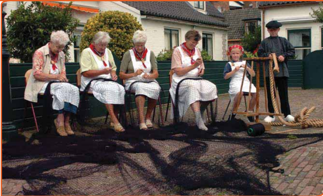
Historische verenigingen kunnen een grote rol spelen in het inventariseren en documenteren van het immaterieel erfgoed. Folklore- en levende geschiedenis groepen zijn van belang om het immaterieel erfgoed zichtbaar te maken voor een breed publiek. Foto: Netten boetende vrouwen, Jan Stads

keurslijf mogen worden. De uitvoering van het beleid ligt bij anderen: het veld. Voor de provincie zijn de belangrijke partners in het veld: de Stichting Cultureel Erfgoed Zeeland, professionele instellingen (zoals archieven, documentatiecentra en musea) en de diverse vrijwilligersorganisaties.