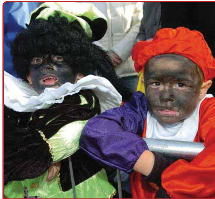
Telkens opnieuw duikt de discussie op of Zwarte Piet racistisch is.

Omdat het begrip 'traditie', als erfenis van oudere volkskundige theorieën, de notie van zelfredzaamheid in zich draagt, wordt het waarschijnlijk weinig ingezet in deze woordenstrijd. Of de intocht 'sociale cohesie' bevordert, is blijkbaar niet altijd evident. 'Cultureel erfgoed', waarin een appèl op steun besloten ligt, lijkt hier wel potentie te hebben. Dat is ook de inzet van nationale organisaties als de Stichting Nationaal Sint Nicolaas Comité, de Vereniging tot Behoud van Sinterklaas en de Stichting Vrienden van Sinterklaas. Mocht de sinterklaasintocht als zodanig erkend