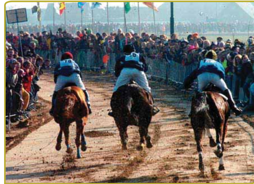
Nederland is rijk aan immaterieel erfgoed, zoals het metworstrijden in Boxmeer.

Ik verwacht dat er waarschijnlijk een combinatie van organisatiesoorten nodig is voor het succesvol implementeren van de Conventie binnen de Lidstaten ervan. Overheden kunnen de financiering leveren, de autoriteit, vormen van officiële legitimering en de connectie met andere sectoren – het onderwijssysteem, planning van economische ontwikkeling, toerisme, kunst en cultuur, de media – bruikbaar voor de verwezenlijking van de doelstellingen van de Conventie. Universiteiten kunnen training bieden en expertise in een verscheidenheid aan relevante disciplines en een scala aan onderzoekstaken – van documentatie van bepaalde tradities in inventarisaties tot de beoordeling van ‘wat werkt’ in de zin van plannen van aanpak gericht op het daadwerkelijk beschermen van immaterieel cultureel erfgoed. Musea kunnen worden ingezet als plaats voor activiteiten – opslagplaatsen voor archieven en gerelateerde verzamelingen, plaats voor de openbare presentatie van immaterieel cultureel erfgoed en publieke educatie – en voor hun expertise, raamwerken voor het omgaan met cultureel erfgoed, en in het gunstig-