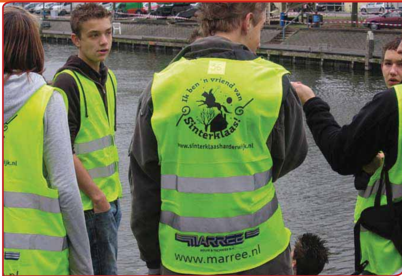
Ieder jaar is er veel hulp nodig om de intocht in goede banen te leiden, gelukkig heeft de Sint veel vrienden.

laten zien. In Assen werd daarvan in 2006 veel werk gemaakt door minister-president Balkenende een groot spandoek met zo'n tekst te laten onthullen.