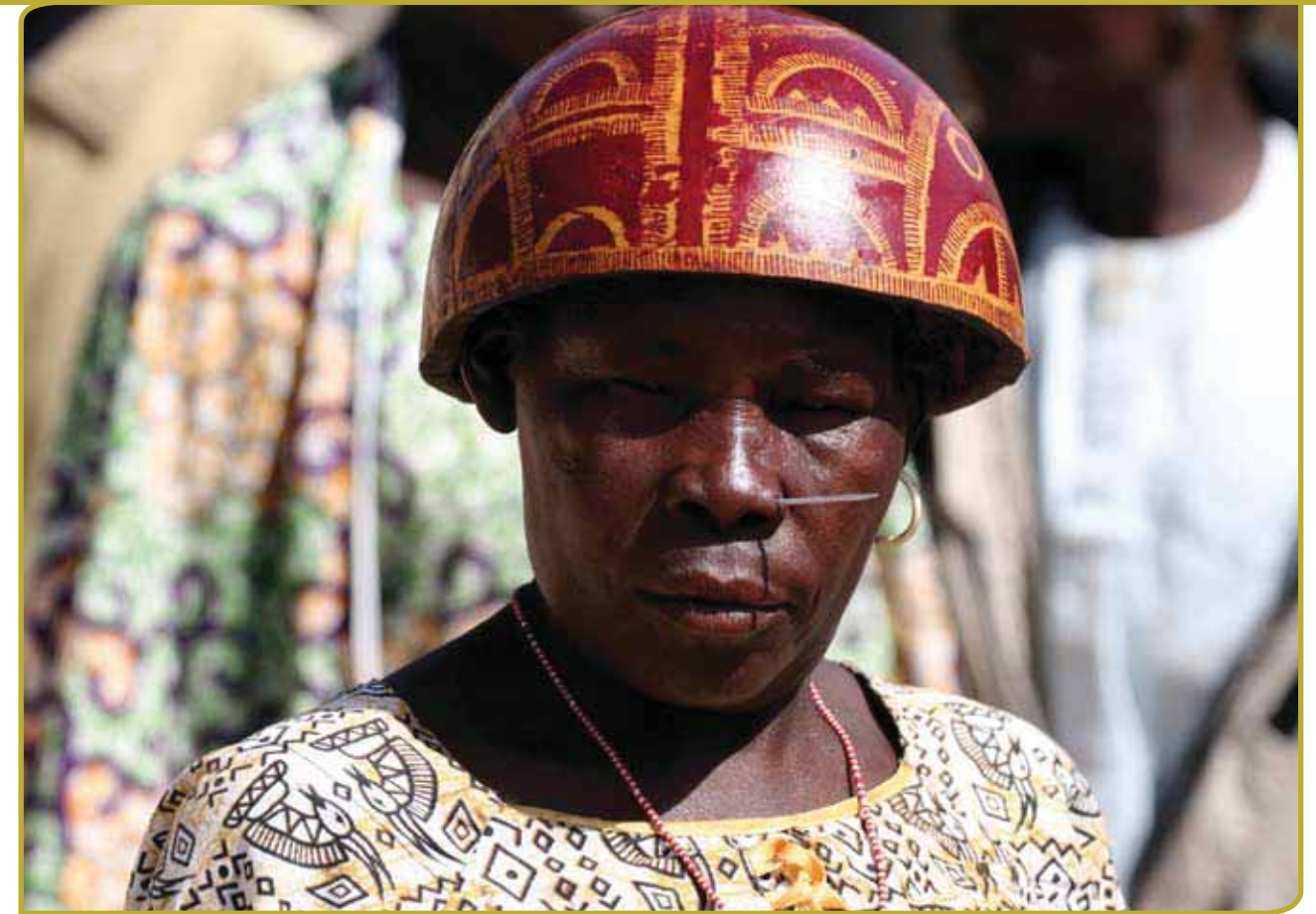
UNESCO wil wereldwijd het immaterieel erfgoed beschermen.

Zowel de praktijken, voorstellingen, uitdrukkingen, kennis, vaardigheden als de voorwerpen, artefacten en culturele ruimtes die daarmee worden geassocieerd, die gemeenschappen, groepen en, in sommige gevallen, individuen erkennen als onderdeel van hun cultureel erfgoed. Dit immaterieel cultureel erfgoed, overgedragen van generatie op generatie, wordt voortdurend herschapen door gemeenschappen en groepen als antwoord op hun omgeving, hun interactie met de natuur en hun geschiedenis, en geeft hen een gevoel van identiteit en continuïteit, en bevordert dus het respect voor culturele diversiteit en menselijke creativiteit.