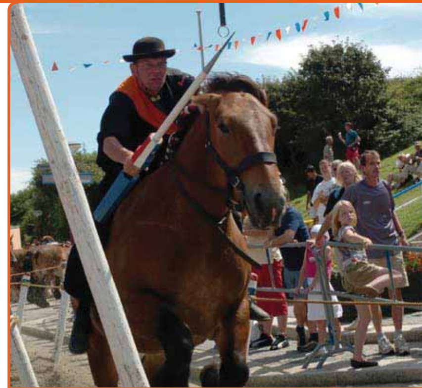
Zeeland was de eerste provincie waar beleid voor immaterieel erfgoed gemaakt werd. Foto: Ringrijden, Jan Stads

manier hoopt het centrum, wat het immaterieel erfgoed betreft, de komende vier jaar een flinke inhaalslag te maken.