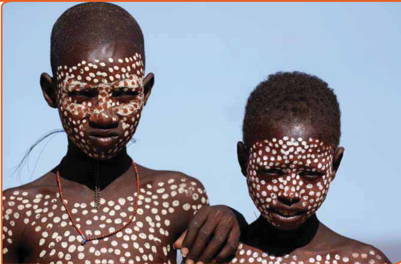
An-Heleen de Greef stelde dat de aandacht voor volkscultuur wereldwijd is gegroeid, omdat men ging beseffen dat het immaterieel erfgoed minder aandacht kreeg dan het materieel erfgoed. Foto: Lichaamskunst Ethiopië, Maurice van Steen, pix4profs

met name voor jongeren heel belangrijk is. Ineke Strouken vroeg de aandacht voor wat zij de 'kleine' ambachten noemde, zoals bijvoorbeeld het beenbewerken.