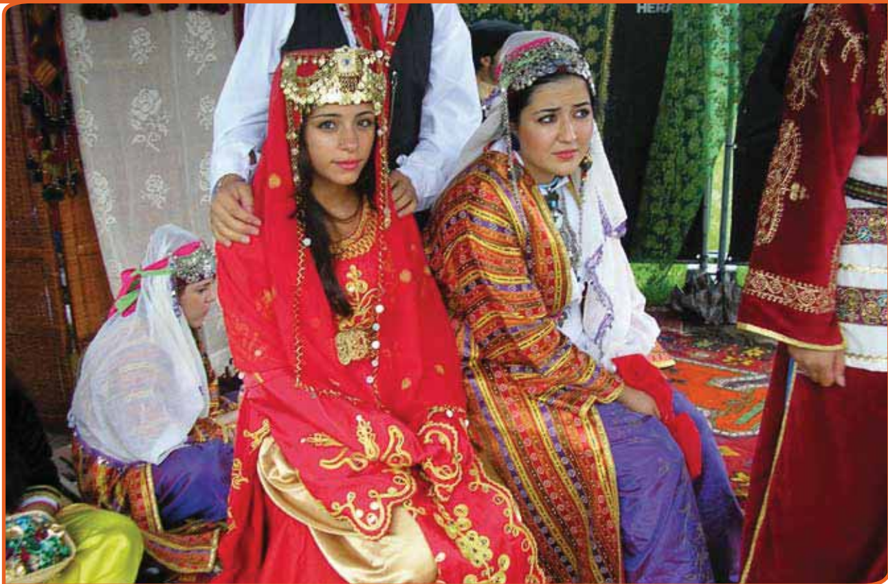
Het immaterieel erfgoed van nieuwkomers hoort ook bij de Nederlandse volkscultuur. Foto: Turks huwelijk

Chinezen (IOC), Inspraakorgaan Turken (IOT), Lize, overlegpartner Rijksoverheid Zuideuropese gemeenschappen, Overlegorgaan Caribische Nederlanders (OCaN), Surinaams Inspraak Orgaan (SIO), Samenwerkingsverband van Marokkanen in Nederland (SMN) en Vluchtelingen Organisaties Nederland (VON). Ze werken samen in het Landelijk Overleg Minderheden (LOM), dat nu tien jaar bestaat en is opgericht onder staatssecretaris Rick van der Ploeg. Het LOM beweegt zich op een breed terrein van activiteiten, onder andere cultuur en cultureel erfgoed. Het LOM spoort cultureel erfgoed op van minderheden of migranten, verzamelt, catalogiseert en ontsluit deze kennis. Voor het LOM is cultureel erfgoed een verzamelbegrip, waar zowel materieel als immaterieel erfgoed onder valt. Dus de verhalen van migranten net zo goed als een mijnwerkerspak van een Italiaan die in Nederland woonde en werkte. Het is wel erfgoed dat gerelateerd moet zijn aan de migratiegeschiedenis