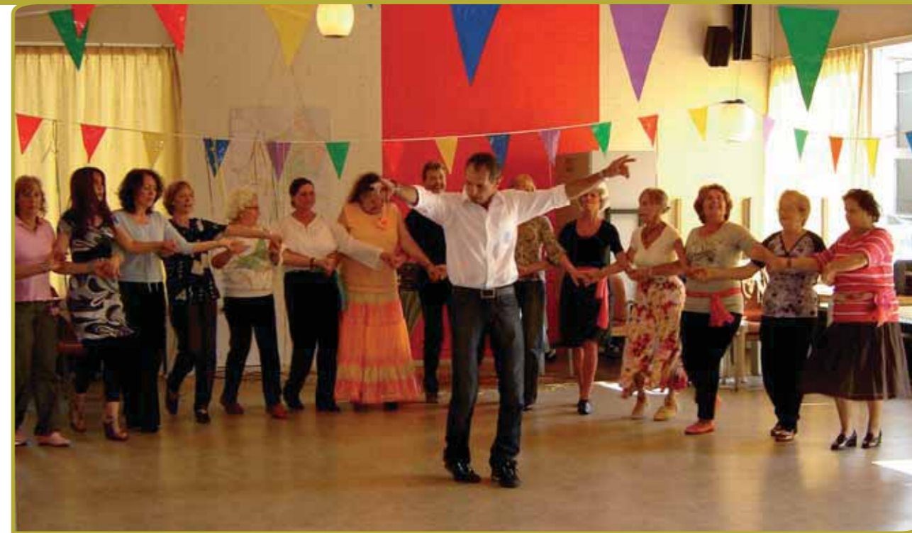
In Amsterdam Nieuw West zijn mensen uit verschillende culturen en van verschillende leeftijden met dansers en acteurs aan de slag gegaan om tradities betreffende eten en feesten met elkaar uit te wisselen.

'Het culturele erfgoed leeft echt op het ogenblik. Overal in het land zijn projecten bezig en verschijnen er boeken. Laat ze hun verhalen maar vertellen. Het schrijven van foutloos Nederlands