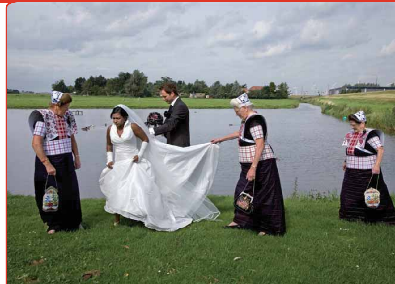
Klederdracht laat zich heel goed combineren met het moderne leven. Drie oma's bij het trouwen van hun kleinkinderen.

Nieuwe dragers komen er niet bij. 'Klederdracht gaat absoluut verdwijnen. Nieuw is alleen de groep Spakenburgse vrouwen,