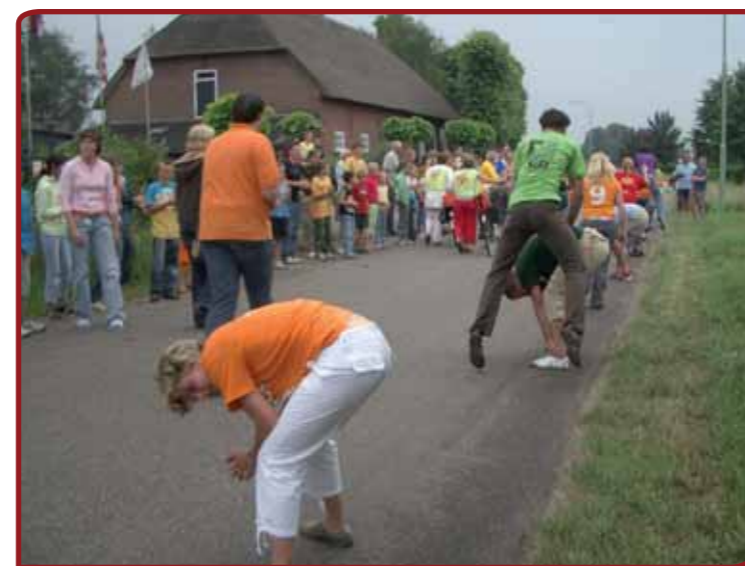
WieKentKunst in Moergestel organiseerde een weekend traditionele sporten en spelen met een marathon bokspringen.

Het servicepunt geeft advies en informatie over volkscultuur en ondersteunt samen met onder meer het Staring Instituut volkscultuuruitingen in Gelderland. Het plan is dat eerst in de ver-