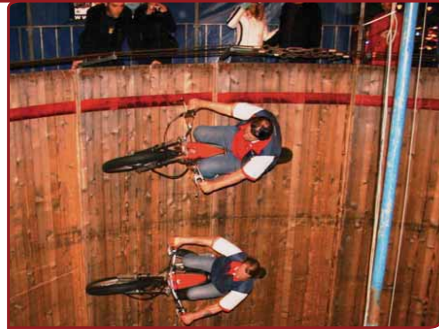
De Gemeente Laren organiseert elk jaar een traditionele kermis met onder andere de steile wand.