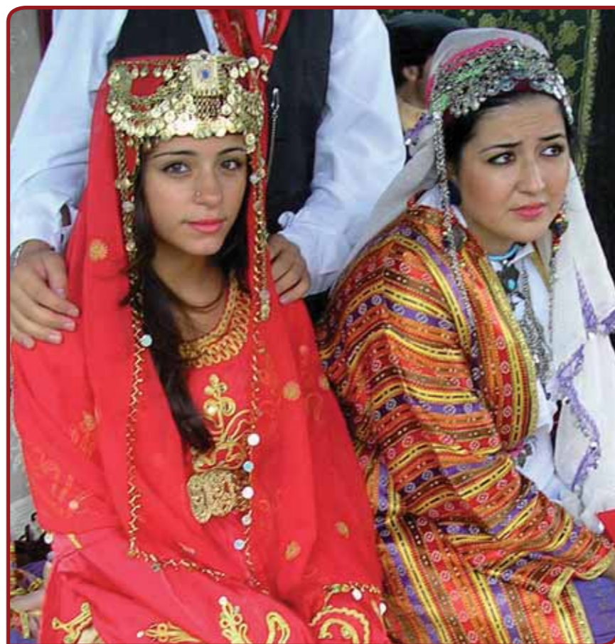
Paspoort Kleurrijk Nederland laat groepen vanuit verschillende culturen de rituelen rond geboorte, huwelijk en dood naspelen.

De achtergrond van het project is dat de gemeente veel aandacht besteedt aan samenhang en binding. Almere is een