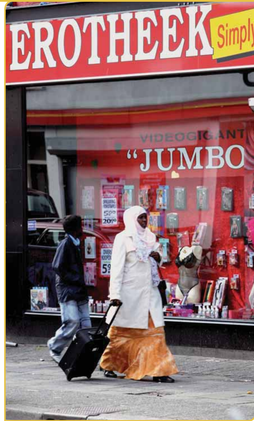
Het Meertens Instituut bestudeert cultuuruitingen in hun culturele dynamiek.

'Volkscultuur is het geheel van cultuuruitingen die als wezenlijk worden ervaren voor specifieke groepen, steeds onder verwijzing naar traditie, verleden en nationale, regionale of lokale