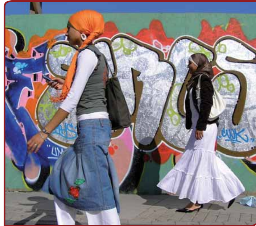
Het Meertens Instituut onderzoekt hoe verschillende bevolkingsgroepen in een multiculturele wijk samenleven.