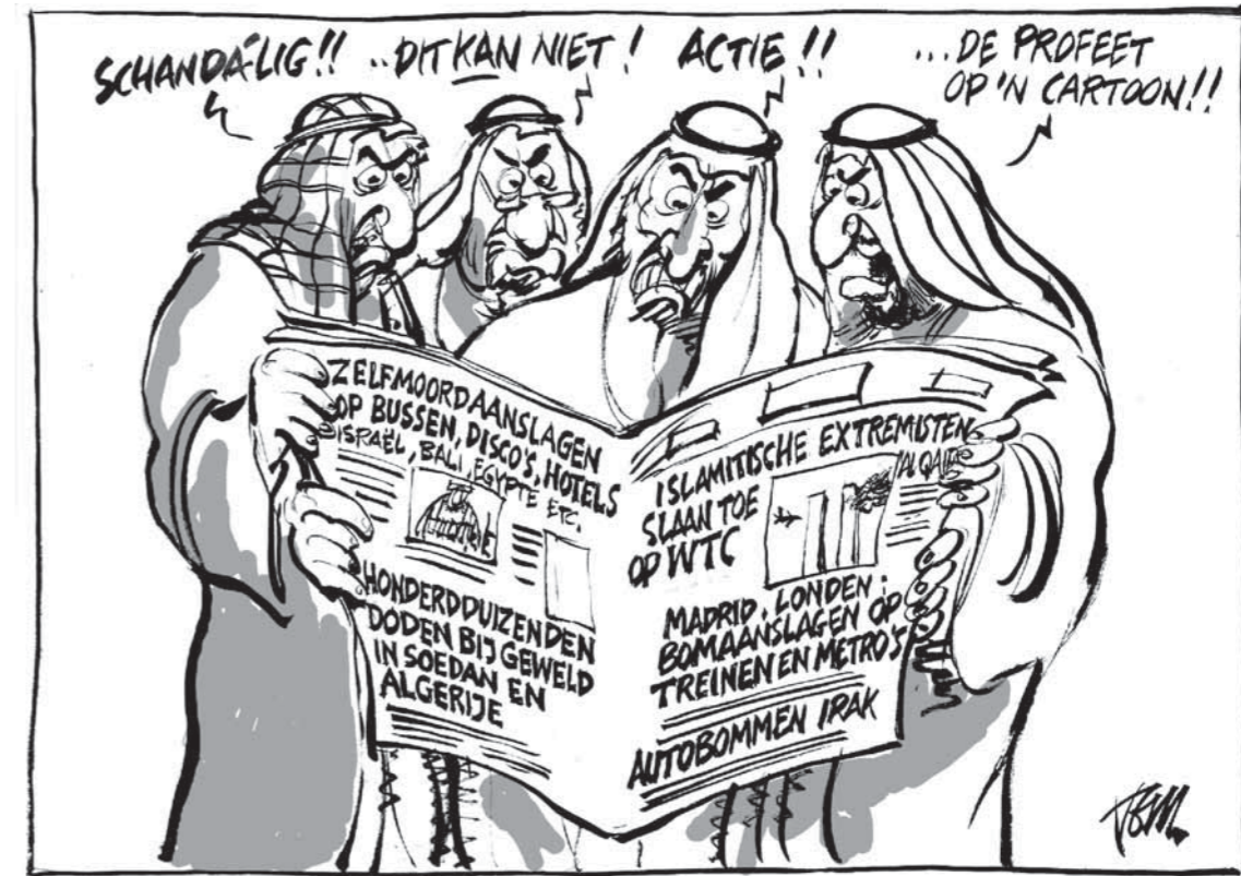
Illustratie: Tom Janssen

Het Catharijneconvent, het andere museum op het terrein van religie en cultuur, laat artefacten en kunstvormen zien. Oriëntalis wil vertellen hoe mensen er mee om gaan. In deze benaderingswijze zoekt Gijsbers de nuancering. 'Aan tradities zit zowel een canonisch aspect, de voorgeschreven orde, als een geleefde praktijk aspect. Je vertelt eerst wat de traditie is en je laat vervolgens de dagelijkse praktijk zien. In onze benadering willen wij laten zien dat de werkelijkheid in de dagelijkse praktijk veel rijker is dan de voorgeschreven orde. 'Wat betekent Mohammed voor jou?' Je gaat verder. Je wilt naar de harten van mensen. De werkelijkheid is altijd veel gelaagder en genuanceerder dan wij