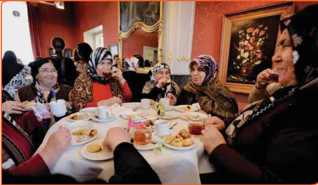
Vrouwen aan de thee in de rode salon van het Noordbrabants Museum. In het kader van de internationale vrouwendag bezochten zij op initiatief van de welzijnsonderneming Divers en Multi Etnisch Vrouwenetwerk de tentoonstelling De ideale vrouw .

verleden te laten zien en voelen. Met beeld, geluid en wellicht ook met geur. Zo was op de tentoonstelling over het kruideniersimperium De Gruyter zelfs de koffie te ruiken. De tentoonstelling over De Gruyter, in 2000, bleek een ware blockbuster , die zo'n 107.000 bezoekers trok. Het bedrijf, ooit de grootste supermarktketen én de grootste werkgever in Den Bosch, was in de jaren zeventig ter ziele gegaan. Het museum verwierf een particuliere collectie, die bestond uit duizenden De Gruyter-producten, winkel- en fabrieksinventaris, reclamematerialen, foto's en films. En het publiek bracht spontaan nog veel meer artikelen naar het museum. 'Onze collectie 'snoepjes van de week' is ongetwijfeld de grootste ter wereld,' lacht De Mooij.