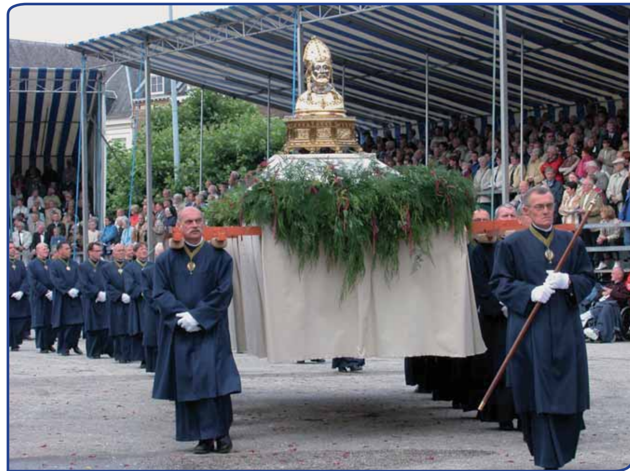
Heiligdomsvaart Maastricht: het dragersgilde van Sint-Servaas met het borstbeeld van deze heilige (met dank aan de Stichting Het Graf van Sint-Servaas)

zijn lokale roots in Volendam) als lager opgeleiden. Volkscultuur biedt tevens uitgelezen kansen om aan te sluiten bij het beleevingsaspect, waarnaar de huidige (cultuur)toerist op zoek is. Living history en life role playing geven de toerist de mogelijkheid om van passieve toeschouwer naar actieve deelnemer te evolueren. Bekende voorbeelden zijn de publieksgerichte activiteiten in de Nederlandse openluchtmusea. Als nichemarkt noemt Munsters ook het creatief toerisme, gericht op actieve verdieping in de lokale cultuur, bijvoorbeeld door als toerist in