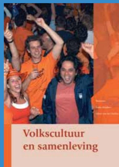
Volkscultuur en samenleving

Volkscultuur en samenleving is te bestellen door € 10,- over te maken op giro 810806 t.n.v. het Nederlands Centrum voor Volkscultuur o.v.v. 'volkscultuur en samenleving'.