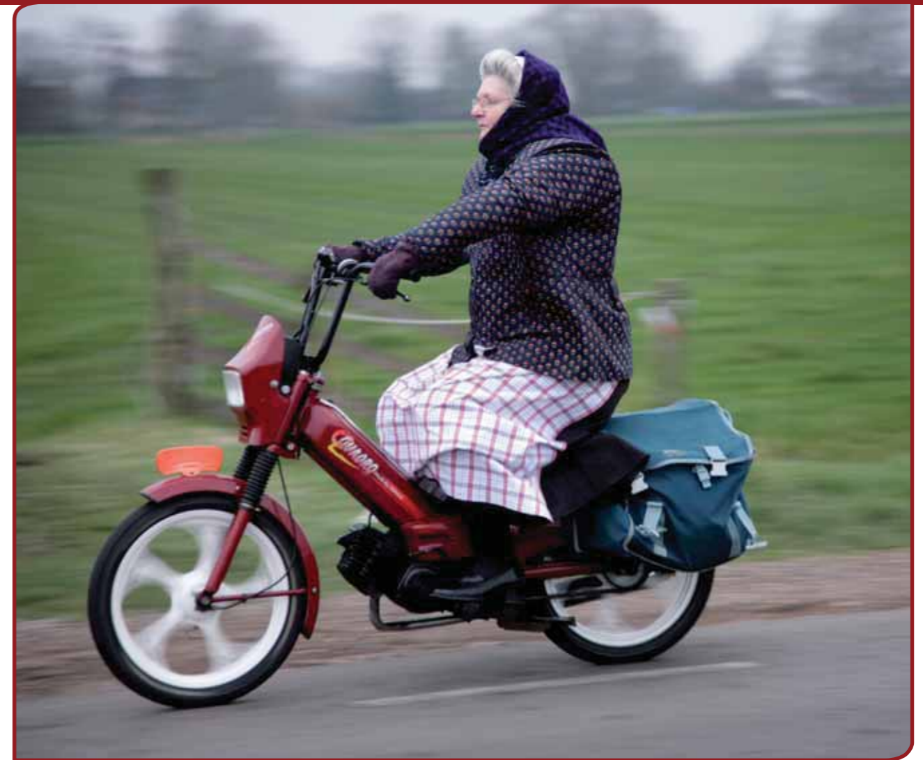
Het project 'Kuiven en Kraplappen' toont dat vrouwen in klederdracht naast hun tradities een succesvol eigentijds leven hebben.

Met de kennis over regionale en lokale gebruiken is het vaak nog slecht gesteld. Volgens Ineke Strouken ligt hier een speciale