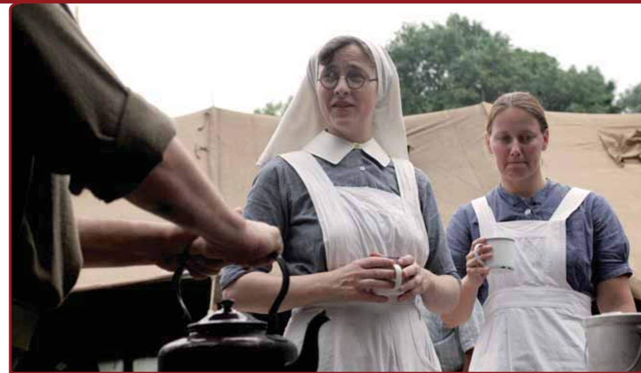
Door middel van levende geschiedenis laat de stad Utrecht zien dat het een belangrijk centrum voor gezondheidszorg is.

schillende regio's – met steun van het Nederlands Centrum voor Volkscultuur – expertmeetings worden georganiseerd, om draagvlak te creëren in de verschillende regio's. Ook is het de bedoeling dat jaarlijks een streekfestival wordt georganiseerd en dat via de website Mijn Gelderland kennis over volkscultuur ontsloten wordt.