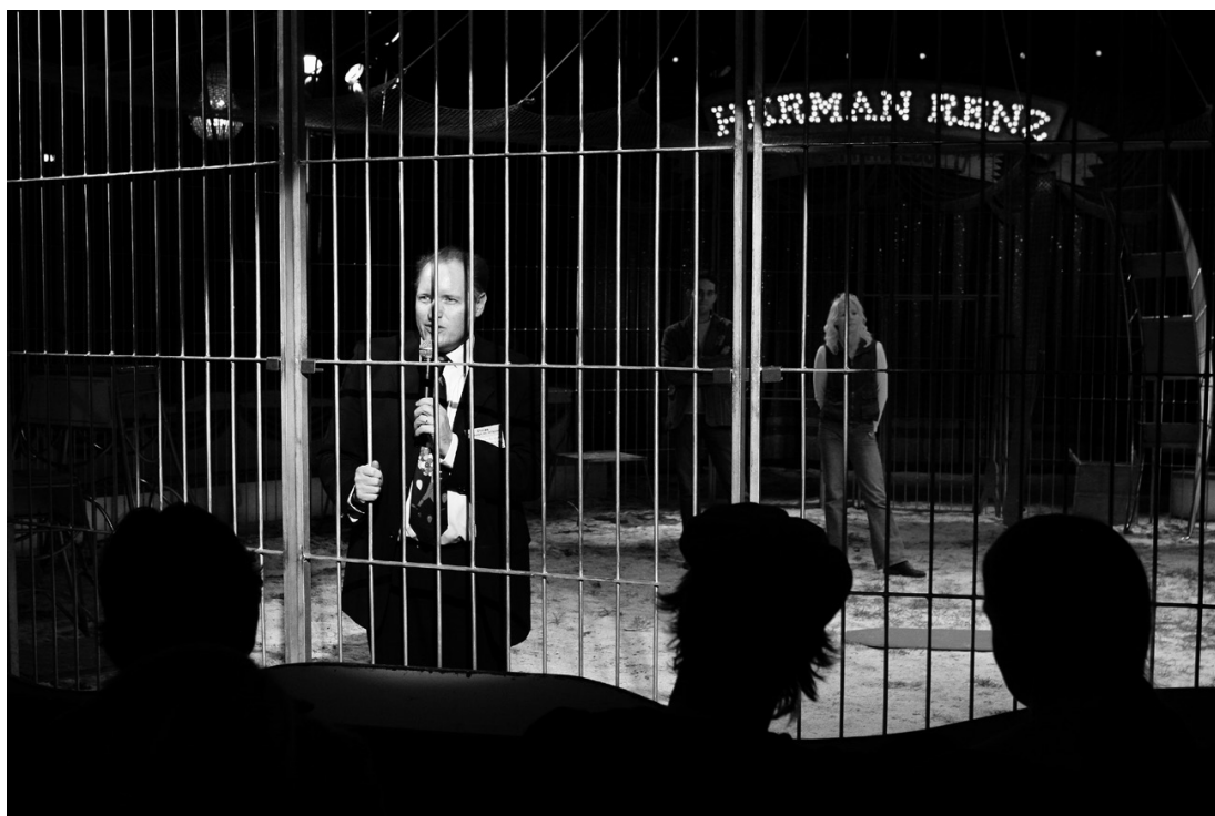
Lezing in een circuskooi tijdens het “Jaar van het Circus” in 2006, georganiseerd door het Nederlands centrum voor Volkscultuur